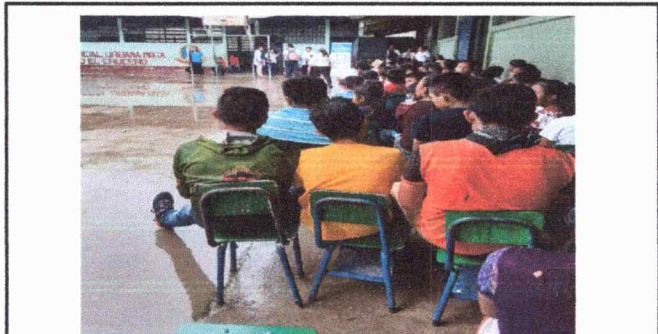
Foto 4: Las aulas se ven afectadas en tiempo de lluvias, ya que ahí convergen las aguas pluviales.