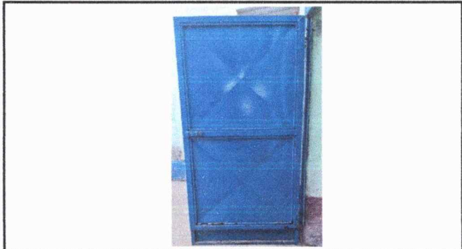
Foto 2: Las puertas de los baños están deterioradas, necesitando mantenimiento.