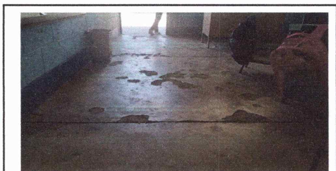
Foto 6: La torta de cemento de varias aulas se encuentra muy deteriorado, siendo necesario cambiar a piso de granito para mejor aprovechamiento y presentación.

Observación: Si es necesario se pueden agregar hojas adicionales y actualizar el número de hojas.