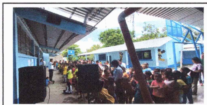
Foto 5: El patio es un área multiusado que afecta a la niñez en las actividades escolares por no contar con entechado.