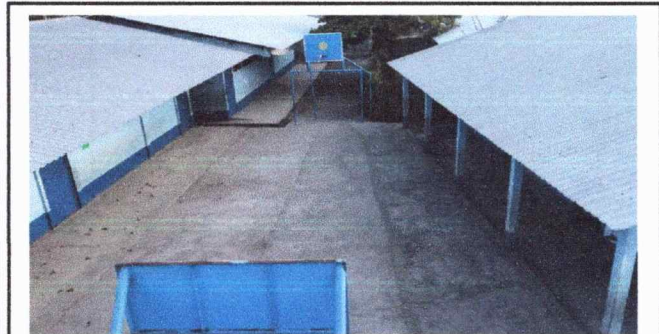
Foto 3: El patio que está entre las aulas aumenta el calor en tiempo de verano cuando la torta de cemento refleja los rayos solares.